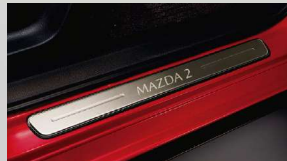
PISA ALFOMBRA ILUMINADO