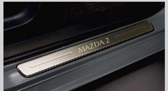
PISA ALFOMBRA ILUMINADO